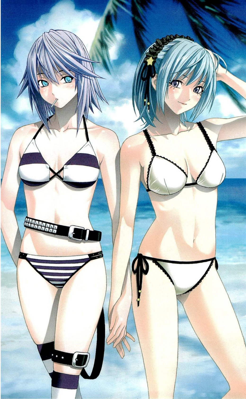
10 На березы