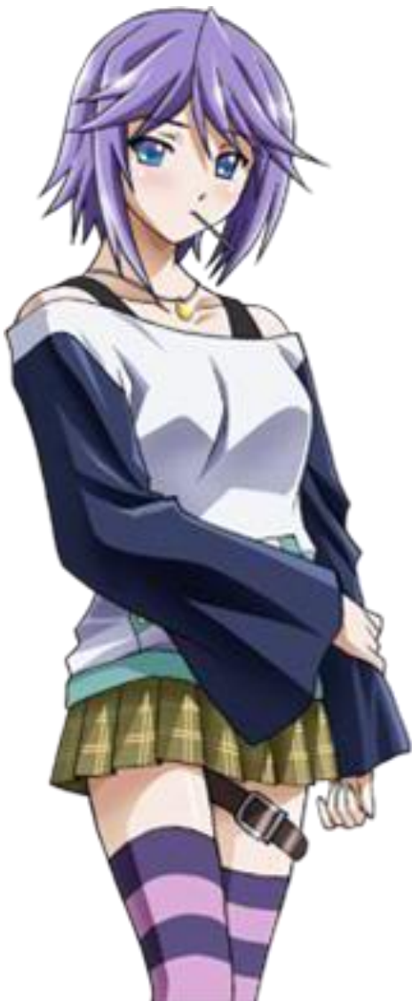
5 Шираюки Мизоре