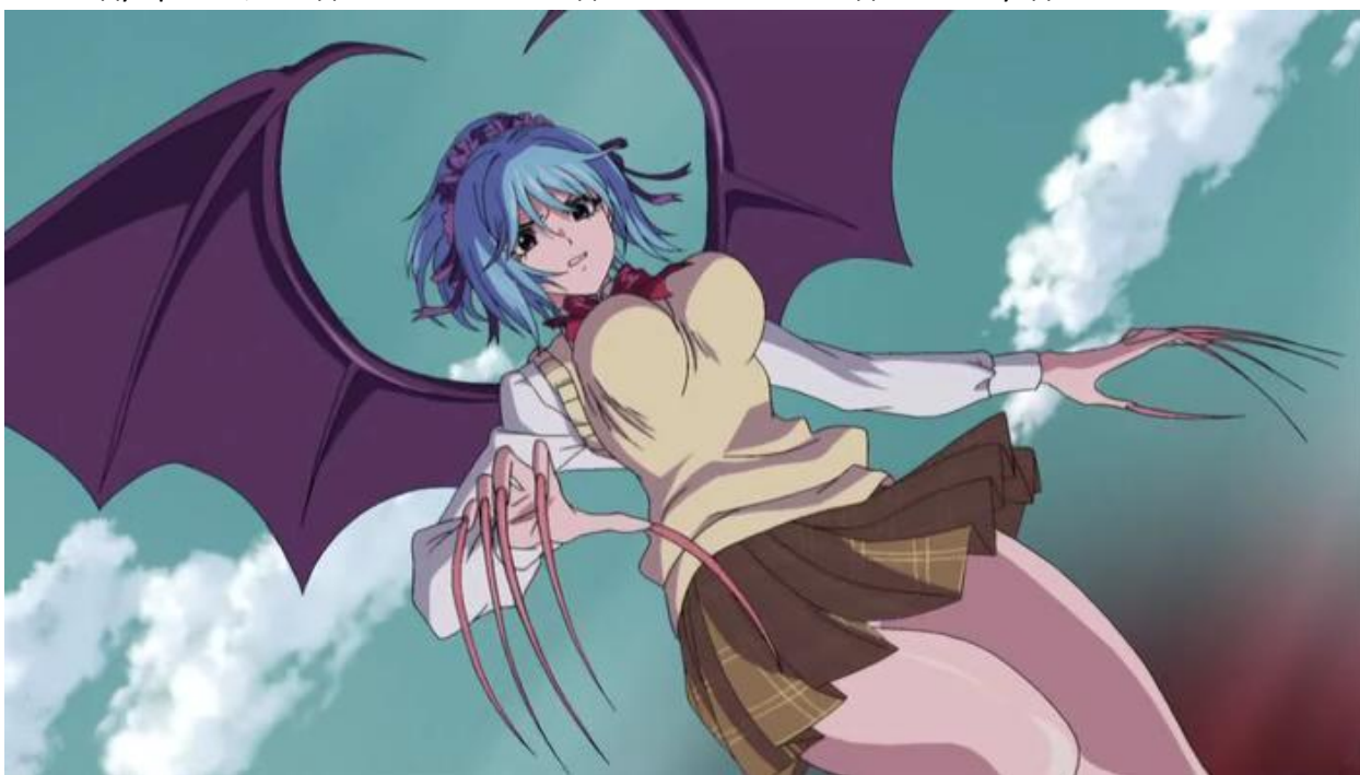
3 Куроно Куруму

– Между прочим, сегодняшняя битвочка длилась всего лишь девять секундочек.