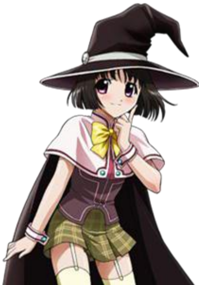
4 Сендо Юкари